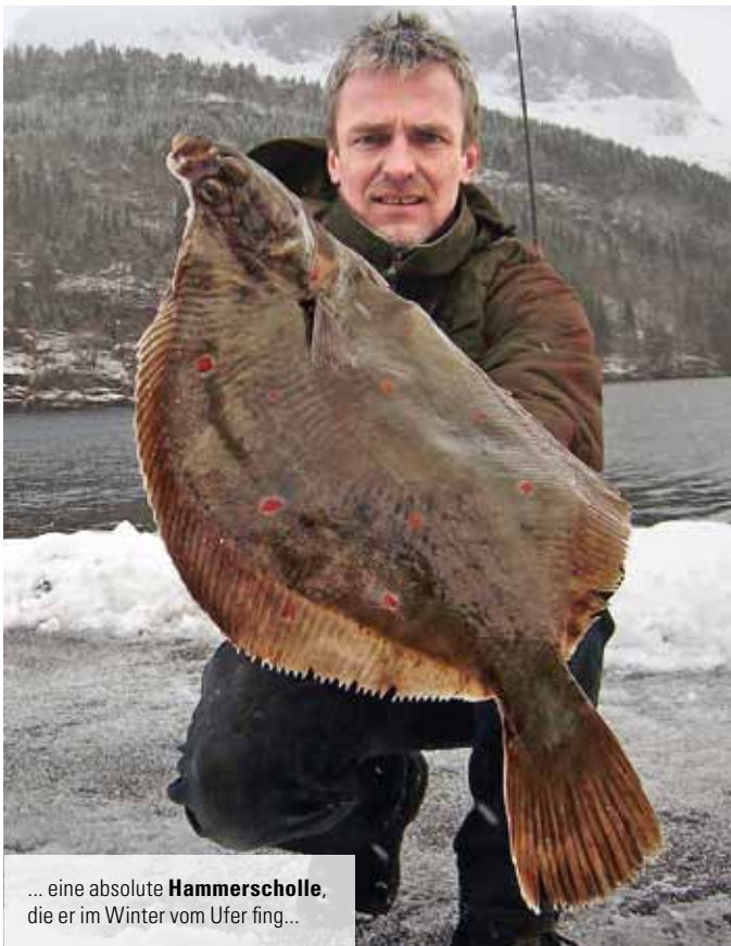
... eine absolute Hammerscholle , die er im Winter vom Ufer fing...